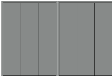
Doppia pagina mm 420x297 + bleed mm 4